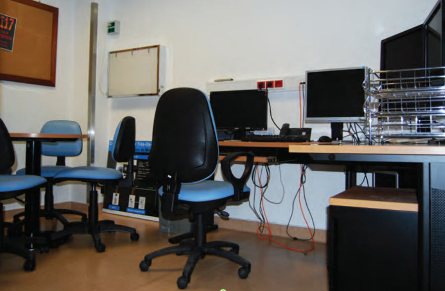
sala de coordenação