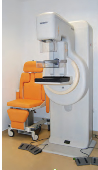
sala de mamografia