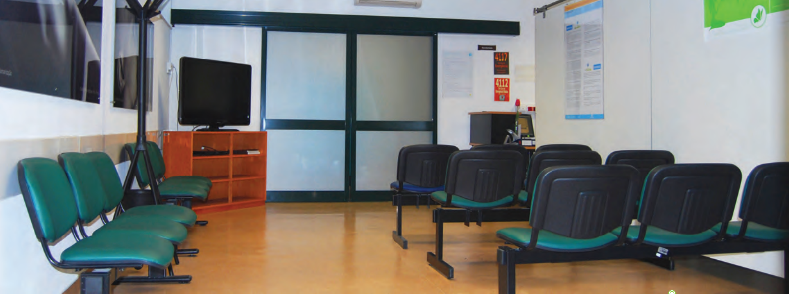
sala de espera da unidade