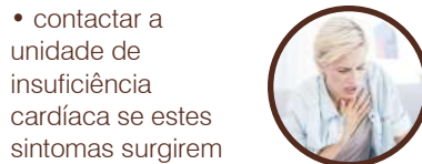
falta de ar