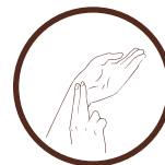
frequência cardíaca (batimentos cardíacos)