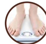
aumento de peso (>2kg em menos de 3 dias)